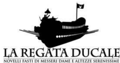
Il logo della manifestazione

E concluse amaramente: “ Ho però il forte dubbio che ben diversa sarebbe stata la partecipazione e l'impegno comunale se la manifestazione fosse stata organizzata da Rovigo anziché da Ferrara, nostra patria culturale, da cui pare si voglia, ogni giorno di più, prendere le distanze.”.