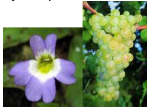
Pinguicola Jaumavensis La Melara e l'uva Melara

Che però il nome fosse riconducibile anche alle piante era invece un aspetto tutto da scoprire. Così troviamo un bel fiore violetto che cresce nel Messico e pure una dolce uva bianca, molto pregiata quanto poco diffusa, che serve legata alla Santa Maria per produrre il famoso Vin santo di Vigoleno nel piacentino.