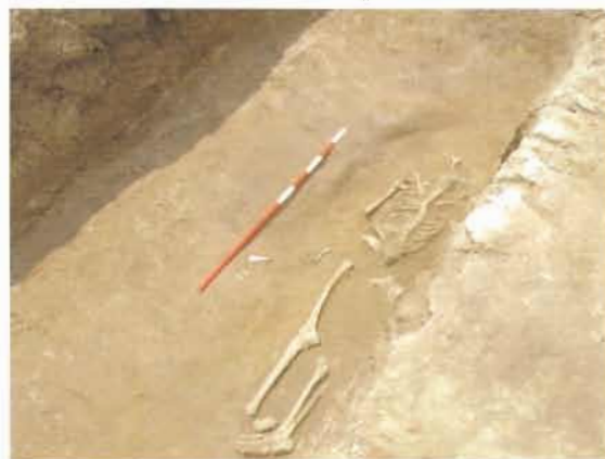
La sepoltura in oggetto

Altri oggetti rinvenuti sono fedi nuziali in bronzo ed anelli vetrificati in blu con sigillo. Tra i materiali rinvenuti sono poi particolarmente numerose, e meritevoli di più approfonditi studi, alcune monete appartenenti ai diversi Stati del tempo. Una così notevole presenza di monete è forse da far risalire alla scaramantica tradizione popolare risalente agli antichi greci e romani che dotavano il cadavere di una moneta sufficiente a pagare l'onorario al traghettatore che accompagnava i morti nell'Aldilà (si tratterebbe del noto obolo di Caronte). Ritornando alle evidenze scientifiche, interessante è stato lo scavo della tomba (1) a fianco della muretta dell'odierna casa canonica, che ha messo in luce i resti di una donna con tutto il suo corredo, composto da oggetti personali quali la fede nuziale nella mano sinistra e due aghi crinali (uno in osso e l'altro in bronzo) posti al centro del cranio, probabilmente per fermare un'acconciatura dei capelli.