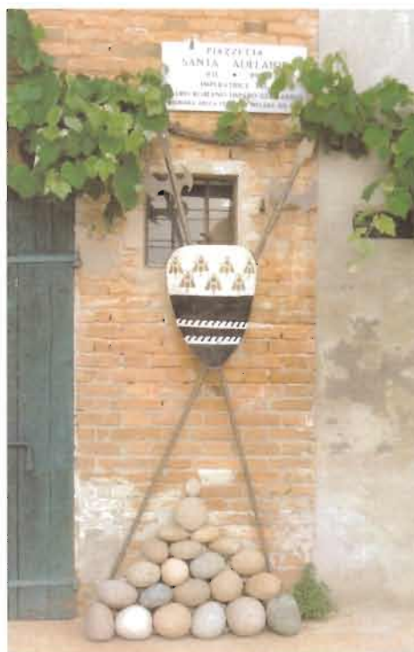
Particolare della piazzetta S.Adelaide

Note: La piazzetta della famiglia Chiavegatti, dietro via Garibaldi, meriterebbe di essere visitata dalle Scuole locali, essendo possibile tema di insegnamenti storici generali e locali (ricordo della donazione di Melara, esame dello stemma con i simboli del paese, tipologia di armi usate nel medioevo, ricordo delle bonificazioni dei benedettini, coltivazione della canapa ecc.). L’Associazione Culturale “Mellaria”, a richiesta, si rende disponibile, a fornire agli studenti, in occasione delle visite, un piego a ricordo dell’avvenimento storico.