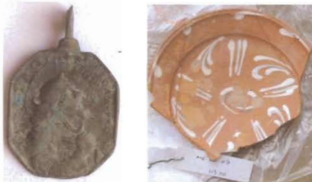
Una medaglietta devozionale ed un piatto emersi dagli scavi

votive in bronzo, con sopra incise icone del culto cristiano in specie dedicate a S. Antonio di Padova ed alla Madonna Lauretana il cui culto si era andato a diffondere rapidamente a partire dalla fine del XVII secolo.