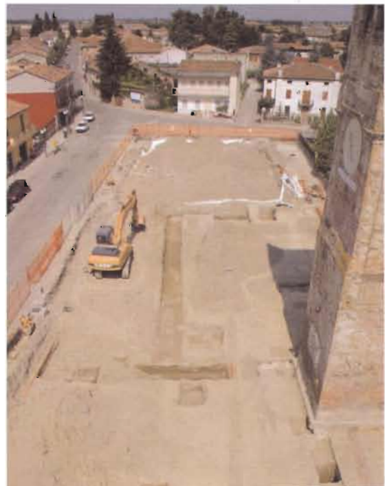
I lavori alla piazza visti dall'alto

RAFFAELE RIDOLFI: La chiesa arcipretale di Melara, primi rinvenimenti archivistici sulla costruzione , Melara 1994; Atti e vicende quotidiane dei transpadani ferraresi nei carteggi dei Rettori estensi - il caso della Visconteria di Melara nei secc. XV-XVI , Ferrara, 2003.